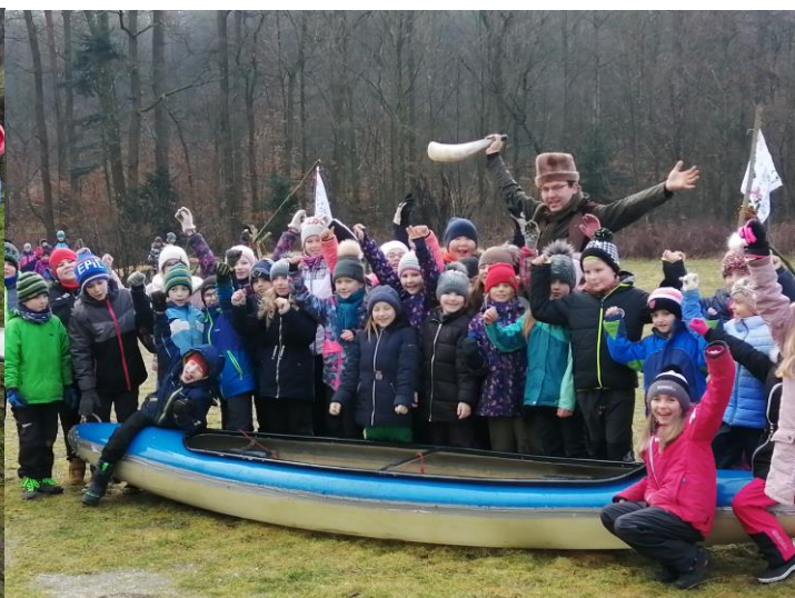
Nalezený vrak loď