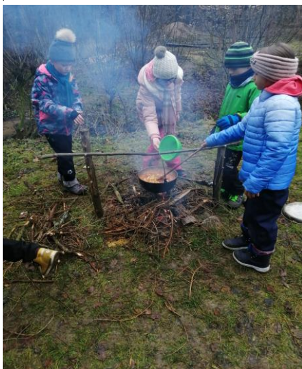
Vaření guláše nad ohněm

V druhém lednovém týdnu se žáci z 3. A a 3. B zúčastnili pobytového programu na Jezírku v Soběšicích. Úkolem pobytu bylo děti seznámit s podmínkami přežití ve volné přírodě. Po celý týden byly děti motivovány tematickou hrou, při které se učily strategicky myslet, plánovat, rozhodovat se a hospodařit s danými surovinami. Pod vedením zkušených lektorů si na vlastní kůži vyzkoušely mnoho aktivit: střílení z luku na terč, připravovat oheň v přírodě, uvařit si bramborový guláš nad ohněm, vlastnoručně si vyřezat lžíci z měkkého dřeva. Nechyběla ani noční cesta lesem, bludiště v mraveništi, zdobení vlastní vlajky. Děti poznaly během celého týdne mnoho volně žijících živočichů v našich lesích i v cizokrajných zemích.